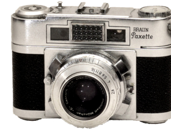
Super Paxette IIB (1957-1959)

I denne serie hævdes overdelen, så der blev plads til afstandsmåleren. Overfladen var nu næsten flad. Frem- og tilbagetransport af film skete med transportarme under overfladen. Afstandsmåler var ukoblet ved Paxette og koblet ved Super Paxette. Belysningsmåler var enten ukoblet eller medføringskoblet (automatic), L betegnede, at der var lysrammesøger, hvilket var gældende for de fleste modeller i 2. serie. Ellers var huset det samme, med to-slag hurtigoptræk og bagklædning, der skulle trækkes under ud. Lukkeren var normalt Prontor SVS