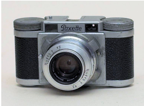
Paxette II (1952-1956)

det "gamle" fremføringsknap. Hurtigoptrækket skulle så aktiveres to gange for at dreje det underste fremføringsknap et billede frem. Den højre knap var todelt og armen bevægede den øverste, som så trak den underste med via et gear. Returknappen blev så rent kosmetisk todelt på ydersiden. Udløseren var placeret til højre på lukkeren og ikke ovenpå huset, en placering Braun fastholde i lang tid.