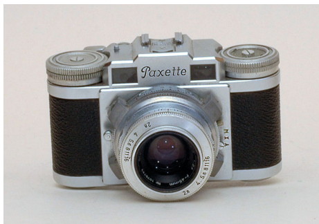
Paxette II M (1953-1956)

Den flade model med vekseloptik. Den viste var den tidlige uden hurtigoptræk og med Prontor S