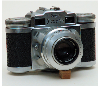
Super Paxette II (1955-1956)

til ukoblet afstandsmåler. Der blev lavet såvel en I M som en II M. Frem- og tilbageknapper bliver hævet med en underdel. Den viste var med hurtigoptræk og vekslobjektiv samt Prontor SVS