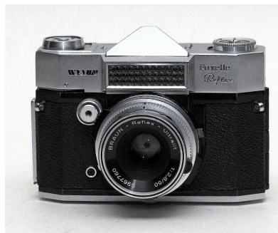
Paxette Reflex Automatic

På trods af navnet var det helt klart et SLR kamera, der byggede på Gloriette/Colorette huset. (se bilag). Når firmaet brugte Paxette navnet hang det nok sammen med, at Coloretten ikke var ret kendt. Teknisk var huset bortset fra selve