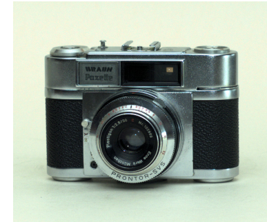
Paxette IL (1958-1962)

Modellen havde koblet afstandsmåler, ikke koblet belysningsmåler og veksloptik. De første kameraer af serie II var med almindelig søger.