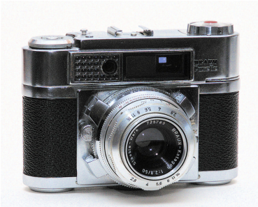
Super Paxette IIBL (1958-1964)

Denne version havde fast objektiv med lysrammesøger. Dette er seriens enkleste model uden afstandsmåler og lysmåler.