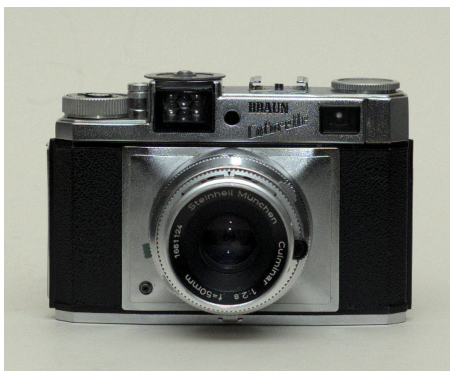
Colorette Super IIB

Serien havde sammen hus som Gloriette, men med bedre filmfremføring med en tandhjulsaksel til begge perforeringer. Lukkerspændingen og dobbeltbelysningsspærren blev nu knyttet til filmopsamleraksen og dermed til hurtigoptrækket (1 slag!). Afstandsmåler var koblet. Kameraet fik lukker af typen Compur Rapid på modellerne med fast objektiv og Syncro Compur ved vekseloptik (Deckels 1. Compur bajonet) begge med lysværdi